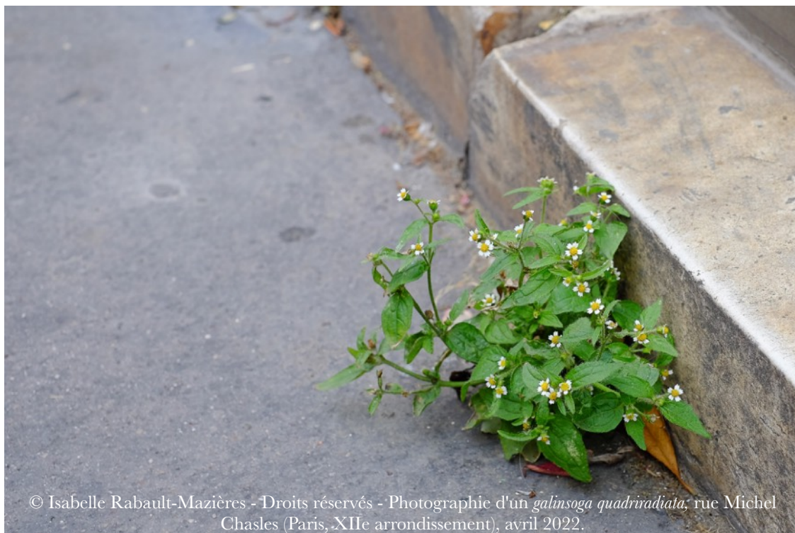
Photographie d'un galinsoga quadriradiata , rue Michel Chasles (Paris, XII e arrondissement), avril 2022.

Cinq photographies d' Eugénie Denarnaud , issues de la série « Écosystème de la route » (2013), seront affichées dans le Théâtre du Parc lors des journées.